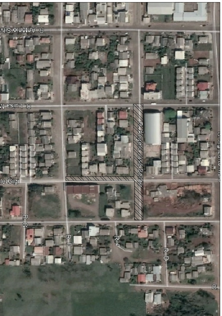
IMAGEM GOOGLE Sem escala