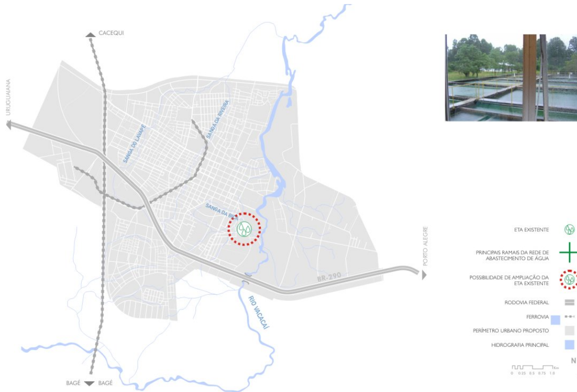
Figura 06 – Sistema de Abastecimento de Água em São Gabriel

A figura 06 mostra a localização da ETA, bem como de outros equipamentos relacionados à questão das águas urbanas.