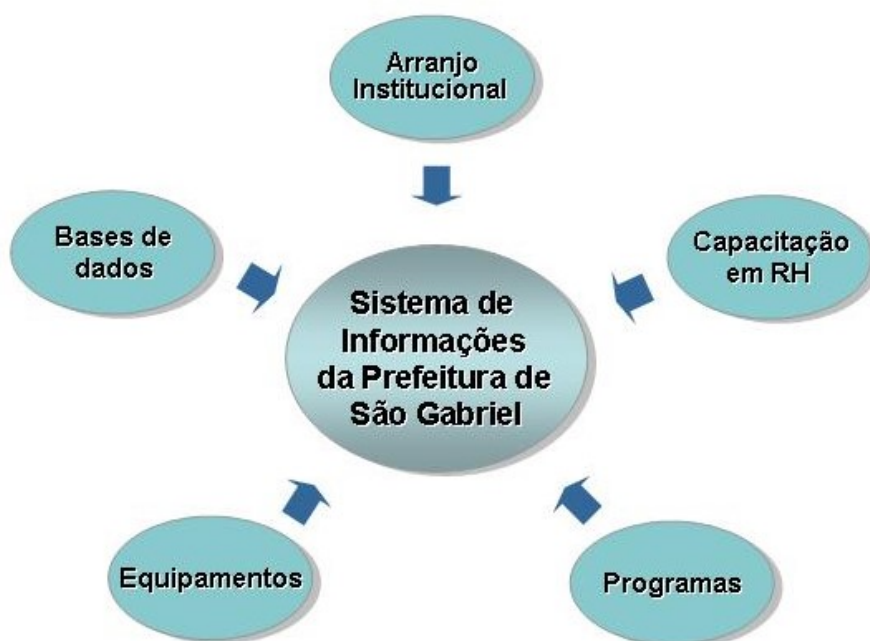
Figura 1: Componentes do SMI_SG.

O SMI_SG (Sistema Municipal de Informações de São Gabriel) deverá reunir, num arranjo institucional, recursos tecnológicos e humanos, capazes de qualificar e quantificar a realidade do Município de São Gabriel a partir de um banco de dados geográficos. Os recursos humanos envolvidos no SMI_SG deverão, de forma contínua e consistente, capacitar-se para trabalharem com o conhecimento mais atualizado envolvendo equipamentos, programas computacionais e práticas sobre organização e representação espacial.