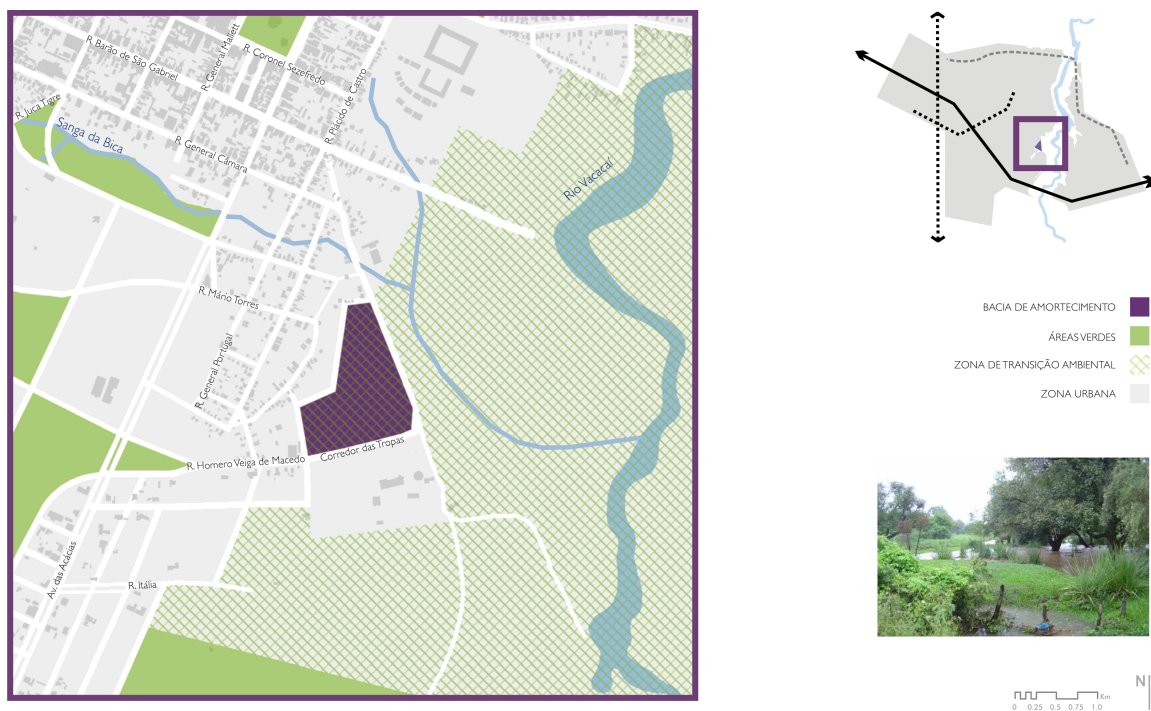
Figura 05 – Bacia de Amortecimento

Para a simulação do funcionamento do sistema e para o pré-dimensionamento das estruturas a serem implementadas, a proposta metodológica geralmente considera cenários de desenvolvimento que variam em função dos seguintes componentes: (a) condições atuais; (b) PDDUA; (c) cenário atual + PDDUA; (d) tendencial; (e) máximo. O cenário atual permite identificar a situação existente de ocupação. Caso forem obedecidas as medidas não-estruturais, passaria a ser o cenário de projeto. O PDDUA estabelece diferentes condicionantes de ocupação urbana para a cidade. Admitindo-se que será obedecido este seria o cenário de projeto. Neste caso as medidas não-estruturais teriam efeito mínimo sobre os futuros desenvolvimentos. O cenário atual mais o PDDUA é o cenário onde parte da bacia apresenta maior urbanização que o previsto pelo PDDUA, ou seja, foi superado. Neste caso, é considerado que o PDDUA seria obedecido para o futuro, com exceção para as áreas já ocupadas. O tendencial identifica o cenário urbano para o horizonte de projeto com base nas tendências existentes. Nos cenários anteriores não é definido o horizonte de projeto (a data para o qual o Plano foi realizado). A ocupação máxima: envolve a ocupação máxima de acordo com o que vem sendo observado em diferentes partes da cidade que se encontram neste estágio. Este cenário representa a situação que ocorrerá se o PDDUA não for obedecido e as medidas não-estruturais não forem implementadas.