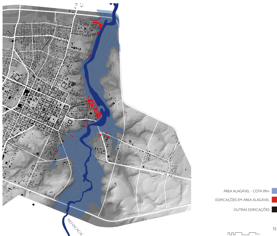
Figura 04 – Áreas inundadas por cheia do Vacacaí com a marca histórica 89.0 m

Para controle dos alagamentos devidos à urbanização (aquelas inundações decorrentes da ocupação do solo com superfícies impermeáveis e redes de condutos, aumentando a magnitude e a frequência das cheias naturais), propõe-se: