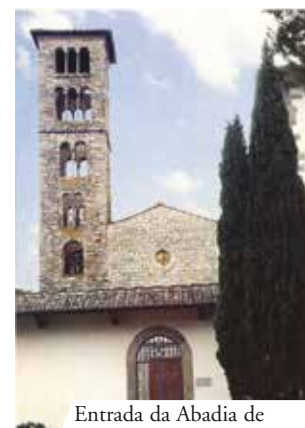
Entrada da Abadia de S. Maria de Rosano