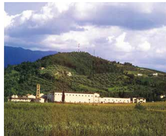
Segundo uma inscrição setecentista posta na fachada da Igreja, a Abadia de S. Maria de Rosano foi fundada em 780