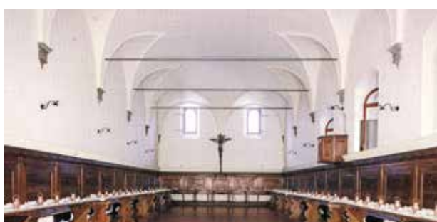
Refeitório da Abadia