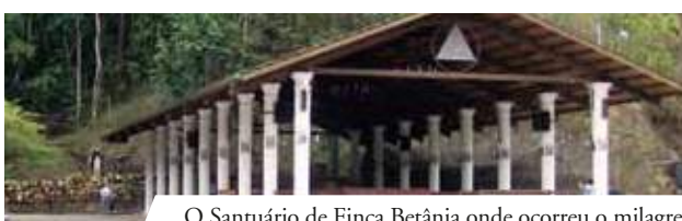
O Santuário de Finca Betânia onde ocorreu o milagre