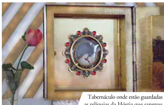
Tabernáculo onde estão guardadas as relíquias da Hóstia que sangrou