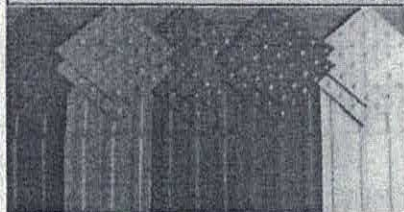
Algumas fotos ilustrativa