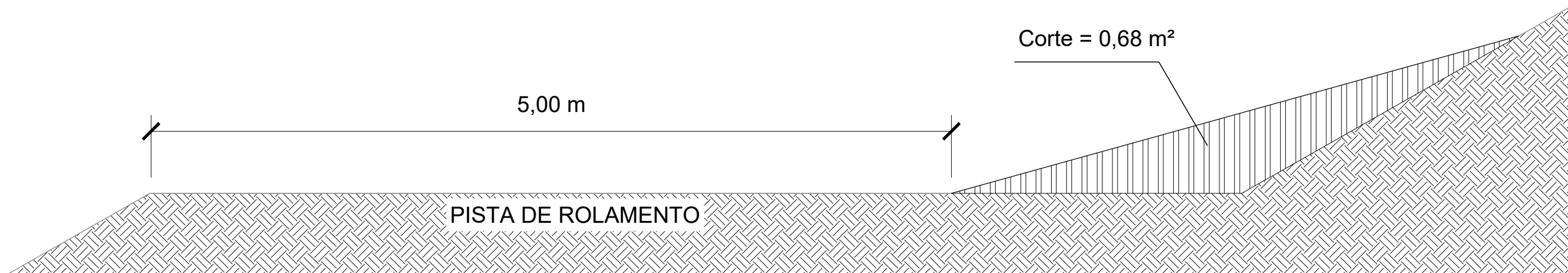
SEÇÃO TRANSVERSAL MÉDIA